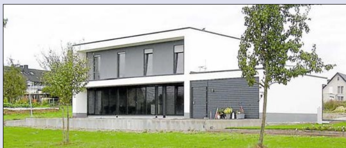
Die Öffnung aller Wohnräume nach Süden und damit zur Landschaft hin, um Umwelt, Natur und Licht jederzeit für die Bewohner erlebbar zu machen, war die Grundidee bei der Planung dieses Hauses am Südende des Baugebietes „Auf dem Schleeberg“ in Ennigerloh, das von Kirchner realisiert wurde.

Bei Kirchner ist man stolz über die Anerkennung durch die Architektenkammer.