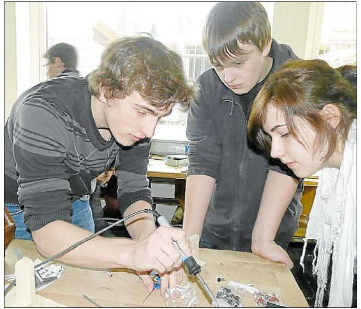
Die Science-Buddys experimentieren mit jüngeren Mitschülern, das Bild zeigt sie beim Bau von Experimentierbausteinen.